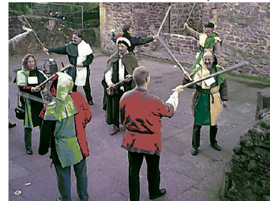
Motivationstraining & Gaudi-Ritterspiele