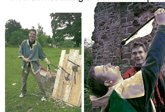
Ritterschlag durch Prinzessin Sobieski zu Schwarzenberg