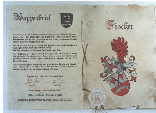
Wappenbrief für Bundesaußenminister Fischer

Schon im Mittelalter wurden Wappen mittels Wappenbrief verliehen. Diese alte Tradition führt der Historische & Kulturelle Förderverein Schloß Alsbach e.V. mit der „ Rhein-Main Wappenrolle „ fort. Dort haben Sie die Möglichkeit alte aber auch neu gestiftete Wappen von Familien, Vereinen und anderen Körperschaften registrieren zu lassen.